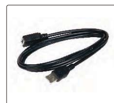
连接线延长线(标配)